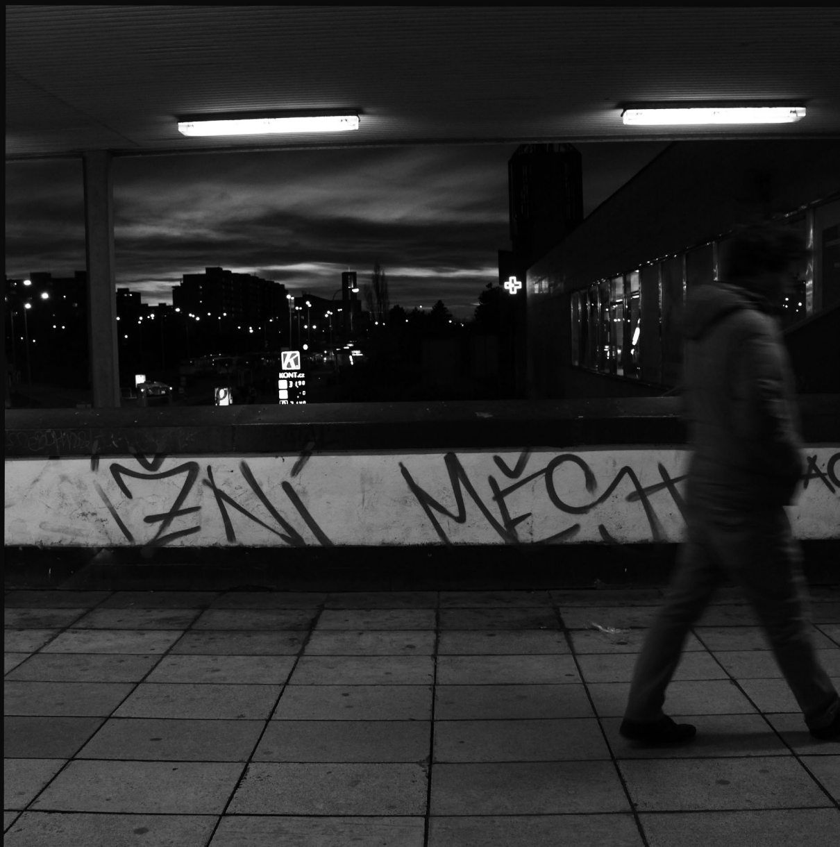
SÍDLISKO HÁJE, PRAHA

MOJA ZBIERKA SYMBOLICKY KONČÍ TAM, KDE VĚRA CHYTILOVÁ PRED ŠTYRIDSIATIMI ROKMI NATOČILA SVOJE PANELSTORY. JE TO ZÁROVEŇ ASI MOJA NAJOBLÚBENEJŠIA FOTOGRAFIA, KTORÁ AZDA NAJKOMPLEXNEJŠIE ZNÁZORŇUJE TO, AKO SÍDLISKO VNÍMAM.