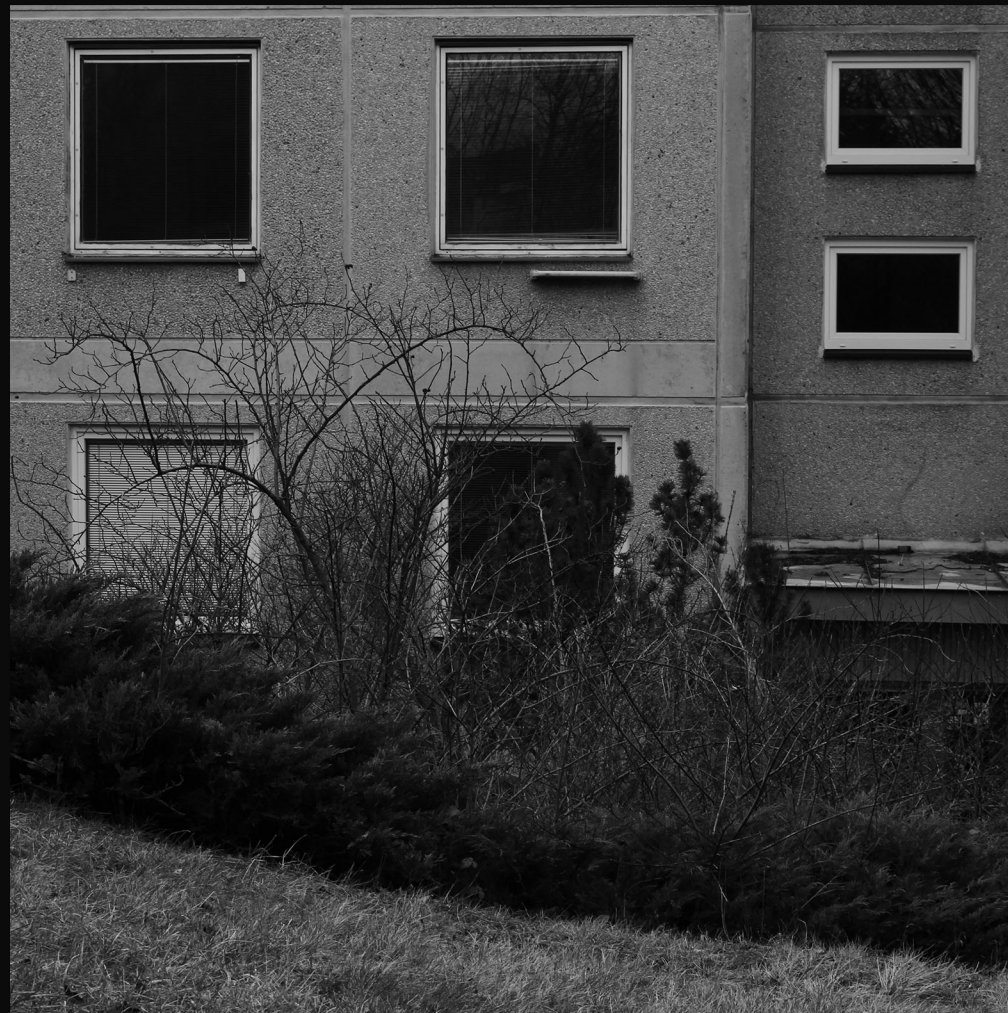
SÍDLISKO MODŘANY, PRAHA

SÍDLISKO JE UNIKÁTNYM PRIESTOROM, V KTOROM K SEBE TIETO DVE SILY PRICHÁDZAJÚ K NEUVERITELNE BLÍZKEMU KONTAKTU. TO VŠETKO AKCENTOVANÉ KONTRASTNOSŤOU ČIERNOBIELEJ FOTOGRAFIE.