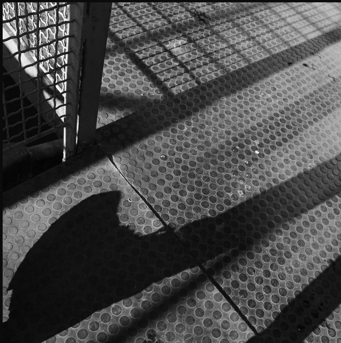
SÍDLISKO PODBREZINY, LIPTOVSKÝ MIKULÁŠ