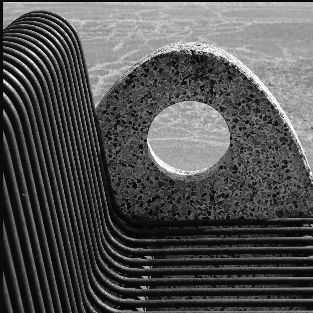
SÍDLISKO JUH III, POPRAD