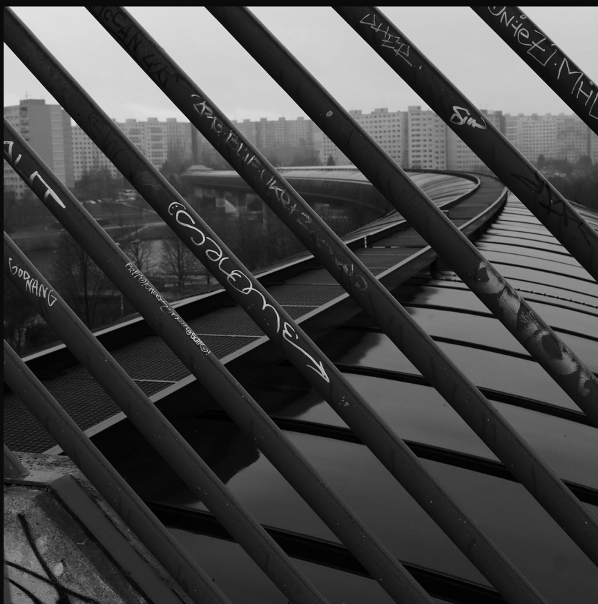
STANICA METRA HŮRKA, PRAHA

NIEKEDY SA NEDÁ ČUDOVAŤ TOMU, ŽE SÍDLISKO MÔŽE PÔSOBIŤ TROCHU SKĽUČUJÚCO. NIEKTORÉ VZORY, KTORÉ VYTVÁRA, SYMBOLICKY REPREZENTUJÚ NESLOBODU POHĽADOV, ČI BYTIA SAMOTNÉHO.