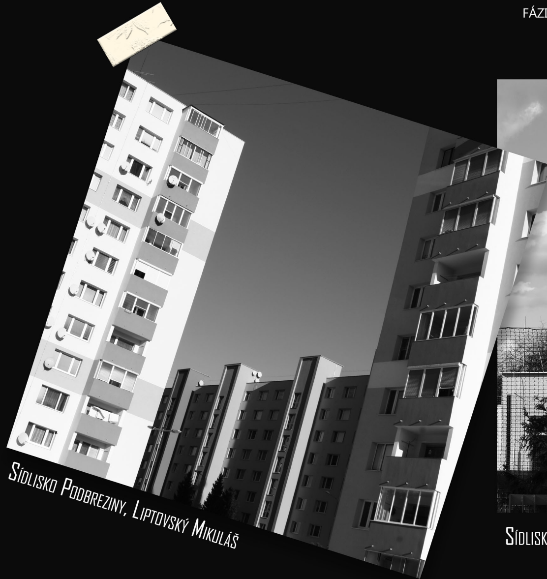
SÍDLISKO PODBREZINY, LIPTOVSKÝ MIKULÁŠ

NEVIEM, ČI TAJOMSTVO ICH KRÁSY SPOČÍVA V ICH FOTENÍ OPROTI OBLOHE. MOŽNO ÁNO, VEĎ HĽADAJÚC KRÁSU, KLUD, POCHOPENIE A NÁDEJ, POHLADY DVOCH TRETÍN NAŠEJ POPULÁCIE SMERUJÚ PRÁVE TAM. A MOŽNO TO JE LEN O TOM "SPRÁVNOM UHLE". NIEČO, AKO KEĎ SI DIEVČA NA ZÁCHODOCH FOTÍ SELFIE.