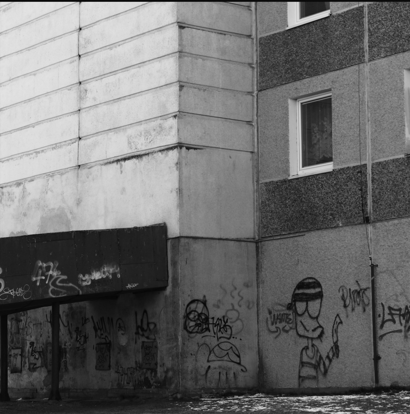
SÍDLISKO JUH III, POPRAD