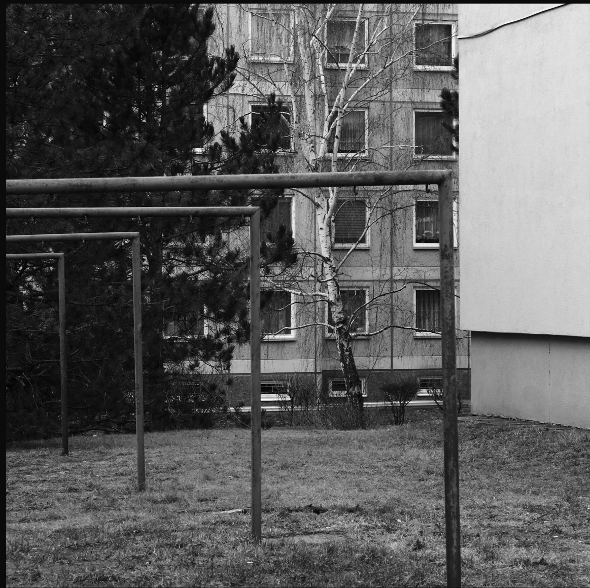
SÍDLISKO MODŘANY, PRAHA

NAPRIEK TOMU MÁM POCIT, ŽE SÚ AKOSI NAJKOMUNIKATÍVNEJŠIE - A ŽE SÚ TO PRÁVE TIETO VZORY, CEZ KTORÉ CHÁPEME, ČO JE SÍDLISKO.