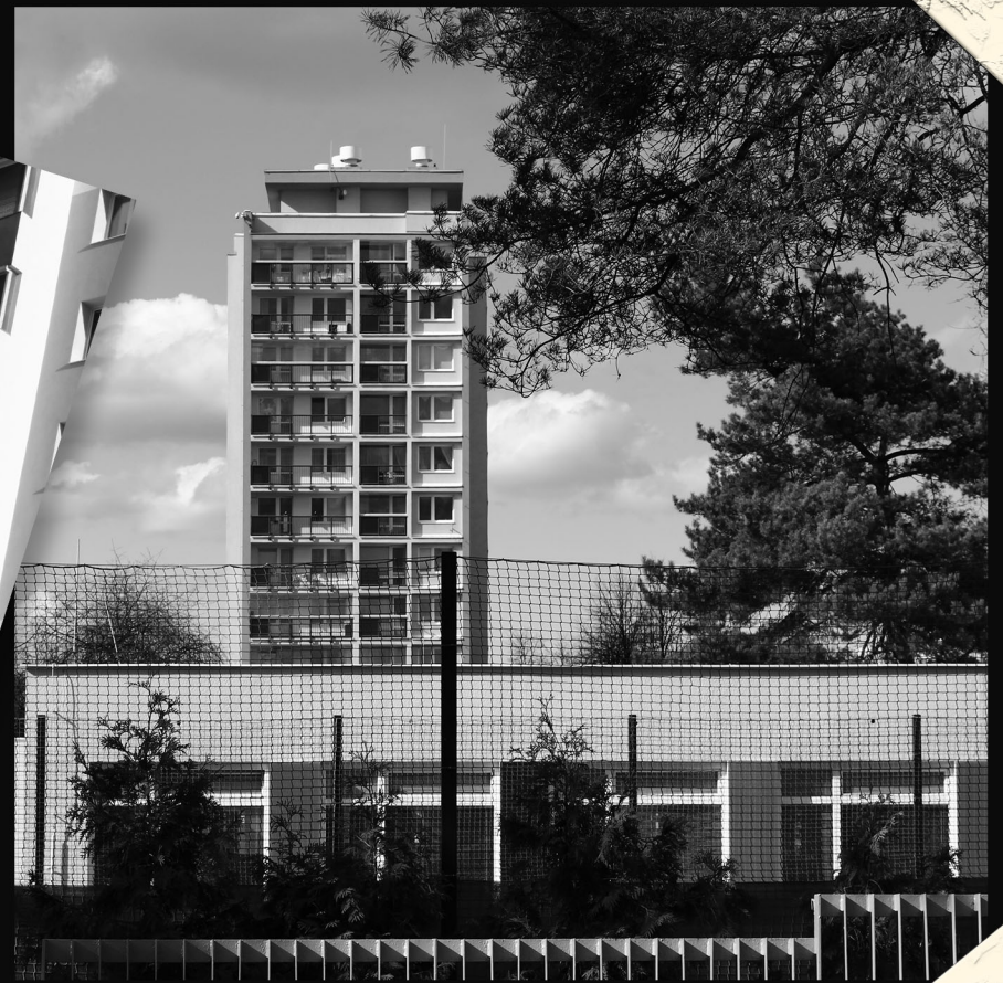
SÍDLISKO NOVÉ ĎÁBLICE, PRAHA

SÍDLISKO NOVÉ ĎÁBLICE BOLO POSTAVENÉ V SKORÝCH 70. ROKOCH. JEHO KONCEPCIA JE ARCHITEKTONICKOU REFLEXIOU POLITICKO-SPOLOČENSKÝCH POMEROV NESKORÝCH ROKOV 60-TYCH. PANELÁKY TAM VYZERAJÚ AKO HOTELY. KEBY POD TÝM NA FOTKE NEBOLA ŠKÔLKA, MOHLA BY TAM BYŤ PLÁŽ S MOROM. JEDNÁ SA O DOM POSTAVENÝ V TZV. KRÁSNEJ, ČI HUMANISTICKEJ FÁZI PANELOVEJ VÝSTAVBY.