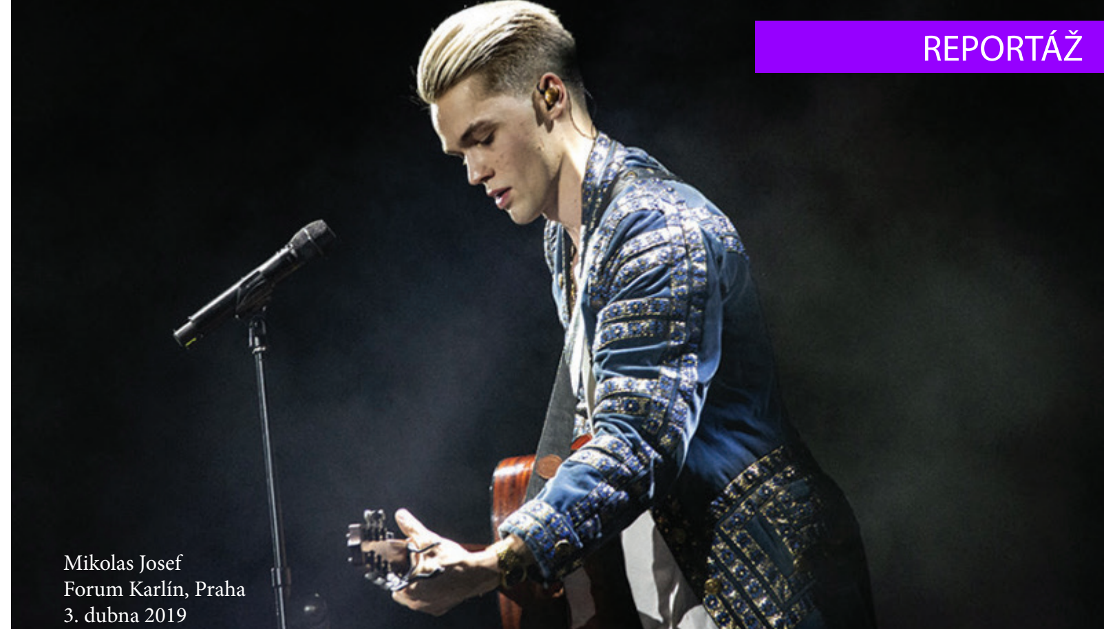
Mikolas Josef Forum Karlín, Praha 3. dubna 2019

O své nemoci Avril Lavigne již mnohokrát otevřeně promluvila, v některých rozhovorech se dokonce neubrnila slzám. Pro ni samotnou představuje album vítěznou osobní kapitolu. Je proto škoda, že při silném osobním příběhu, jaký za vznikem alba z velké části stojí, sráží celkový dojem z desky zejména její nevýrazná druhá polovina. Head Above Water ale nese sympatické pozitivní poselství a obsahuje několik opravdu vydařených skladeb, díky kterým si pozornost zaslouží. •