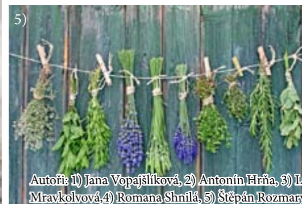
Autoři: 1) Jana Vopajšíková, 2) Antonín Hříba, 3) Líz Mravkolvová, 4) Romana Shnilá, 5) Štěpán Rozmarýn