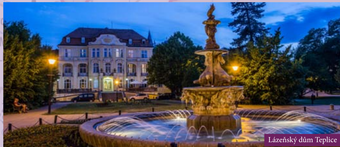
Lázeňský dům Teplice

V roce 1700 prodej františkolázeňské vody v Německu převýšil objem vody pocházející ze všech německých lázní. Město bylo založeno v roce 1793 císařem Františkem I. Po Františkovi I. nese město svoje jméno. Za zakladatele prvních slatinných lázní na světě je považován lékař Bernhard Adler.