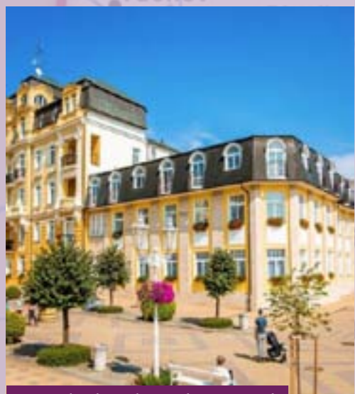
Lázeňský hotel v Luhačovicích

Šlechtic Hroznata založil v roce 1197 premonstrátský klášter v osadě Teplá, pod jehož správou patřilo i území dnešních lázní. Mniši byli také první, kteří zaznamenali slaný pramen ve svých lesích a dokonce se zde snažili odpařováním získávat sůl. Tato sůl byla později úspěšně prodávána jako projímadlo.