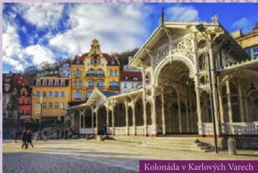
Kolonáda v Karlových Varech