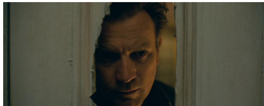
Doktor Spánek (Ewan McGregor)

Už je to téměř čtyřicet let. Osvícení Stanleyho Kubricka se za tu dobu stalo kultovním dílem a dodnes patří mezi nejpovedenější adaptace románů Stephena Kinga. Plíživá kamera a dlouhé interiérové jízdy. Důraz na psychologii postav a jejich proměnu. Tísňivá atmosféra malebného horského hotelu Overlook a nezapomenutelného pokoje 237. Nejen tam se začátkem listopadu vrátíme. Roli průvodce si tentokrát rozdělili režisér Mike Flanagan ( The Haunting of Hill House ) a staro-nový hrdina Danny Torrence (Ewan McGregor), jenž stejně jako jeho otec nemá daleko k lahvi ani šílenství. Podle všeho se dočkáme adaptace, která naraci obou předloh mile propojí. REDJUM