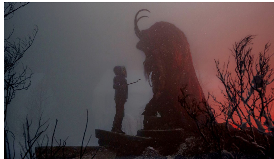
Krampus: Táhni k čertu!