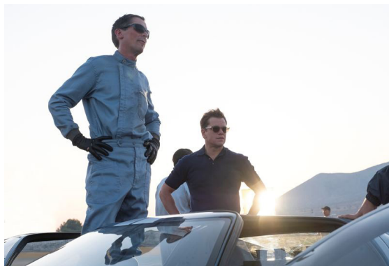
Le Mans '66 (zleva Christian Bale, Matt Damon)

V autech se nevyznám a za svůj největší úspěch považuji to, že jsem se po pěti letech naučil nazpaměť svou SPZtku (což o to, jestli patří felicii nebo fabii, když obě začínají písmenem f). Přesto ale žádný nový film s automobilovou tematikou neujde mé pozornosti. Ne vždy v nich totiž jde jen o závodění. Le