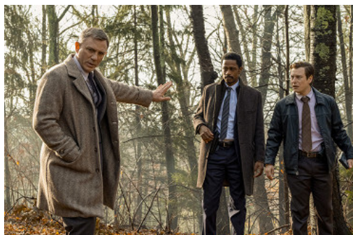
Na nože (Daniel Craig)

Neprůstřelné vesty, malé samopaly, přilby. Po 11. září 2001 se vzhled a výstroj policejních složek v USA kontinuálně posouvají od revolverů a košil směrem k paramilitárním jednotkám. Řadoví britští strážníci, tzv. Bobbies, však kromě obušků a taserů zůstávají neozbrojeni. Analogicky je to i s reprezentací britských detektivů v dějinách literatury, filmu a televize. Ať už to byl Sherlock Holmes, Hercule Poirot (byť Belgičan!) či Tom Barnaby, tam, kde