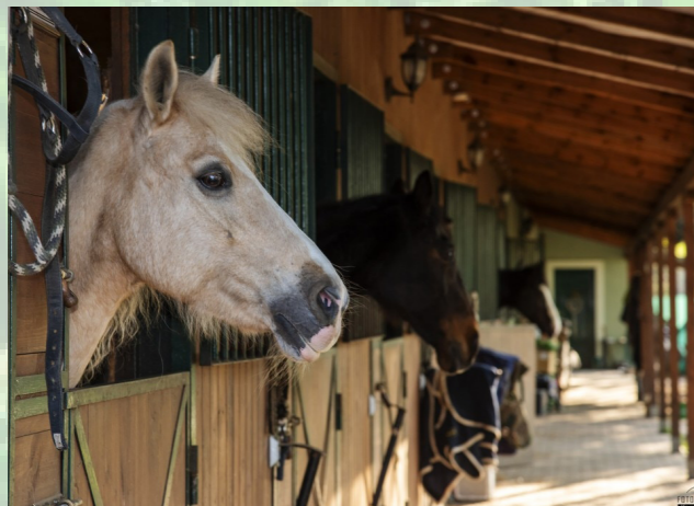
pohled na koně ve stáji